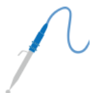
WATERPEN (cm. L 15)

Diffusore molto potente che agisce su meridiani e punti dell'agopuntura. L'elevato flusso di ioni consente di agire in punti mirati e di risolvere imperfezioni cutanee, inestetismi localizzati, affezioni e lesioni: ulcere, piaghe da decubito, ferite, ustioni, cisti, nei, rughe, smagliature, ecc.