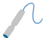
PUNTALE (cm. L 12 x Ø 1)

Può essere fissato all'animale attraverso fasce elastiche o larghi bendaggi.